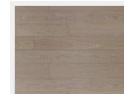
TP19103-VB バイブラントオーク