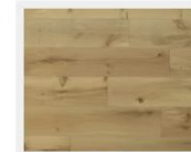
PR24EW-CX シャモニーオーク

中世の雰囲気が漂う格式高い街・パリをイメージしたコレクション。ひとひたりが静かな生き方をするためのくらしのベースとなる。パリのアパルトマンの足元を想起させるデザイン。