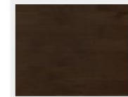
TP19119-AD アドラブルウォールナット

サイズ | 3.47㎡/箱(長さ3033mm×1818mm) ■オーク材-幅191mm・厚さ10.2mm (厚化粧2.2mm×白膠合板8mm) ■ウォールナット材-幅191mm・厚さ10.2mm (厚化粧1.5mm×白膠合板8mm)