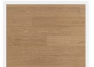
TP19103-NL ナチュラルマイルドオーク