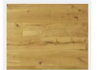
PR24EW-NL ベルサイユオーク

サイズ | 2.95㎡/箱(長さ3040mm×2120mm) 幅240mm×厚さ14.5mm(厚化粧3mm+白膠合板12mm)