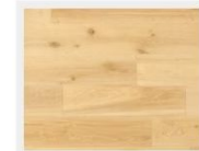
PR24EW-KV ケルヴァニックオーク